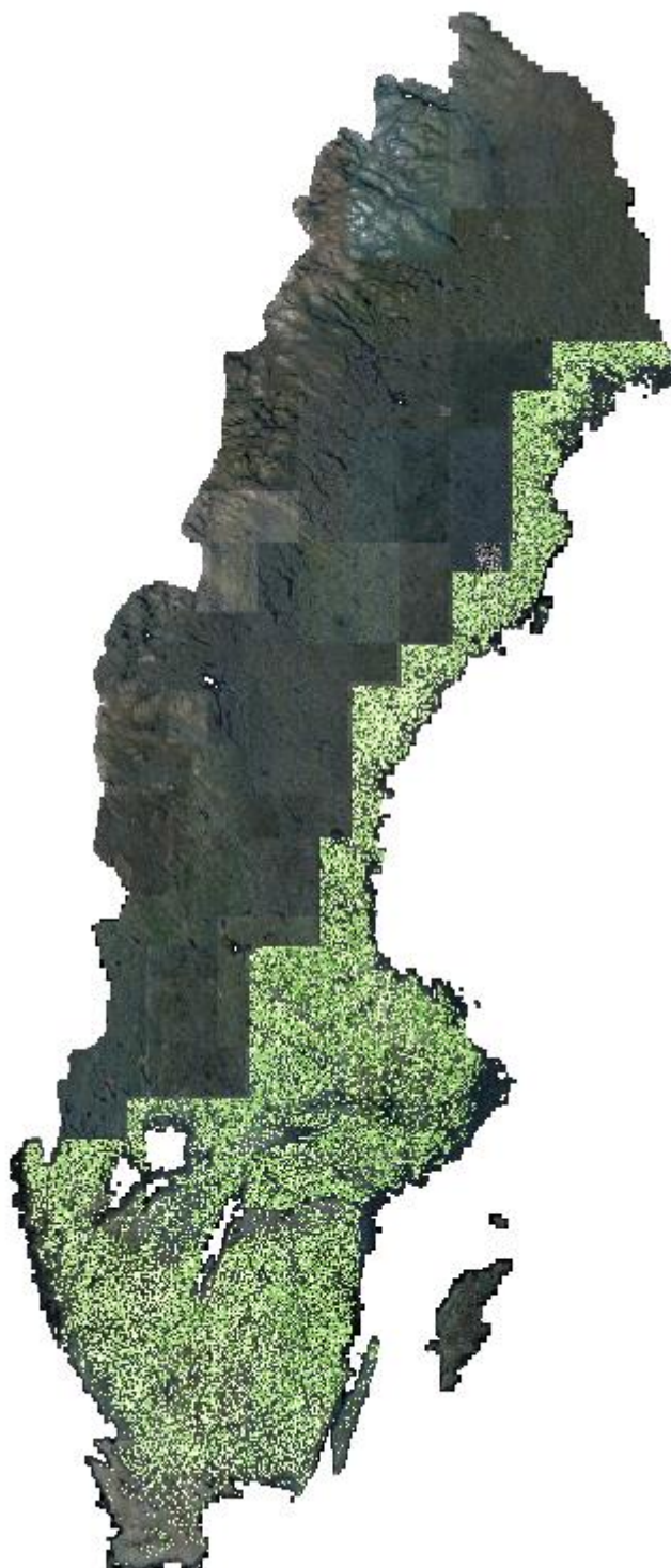
Figur 1. Utbredning av beräknade variabler i SLU Skogskarta.

Den faktiska utbredningen av beräknade variabler i SLU Skogskarta 2015 redovisas figur 1.