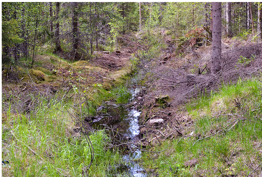
Dike i skogsmark.

Samtidigt har stora resurser satsats på dikesigenläggning av dikade våtmarker för att motverka torka och översvämningar, öka den biologiska mångfalden samt minska utsläpp av växthusgaser. Frågan är vad vi ska göra med alla diken?