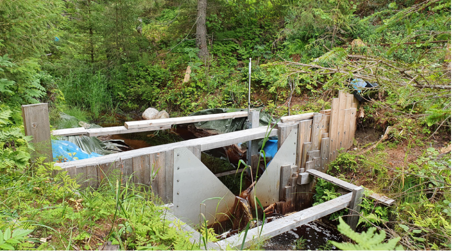
Mätstation vid ett av utloppen från Stormyran.