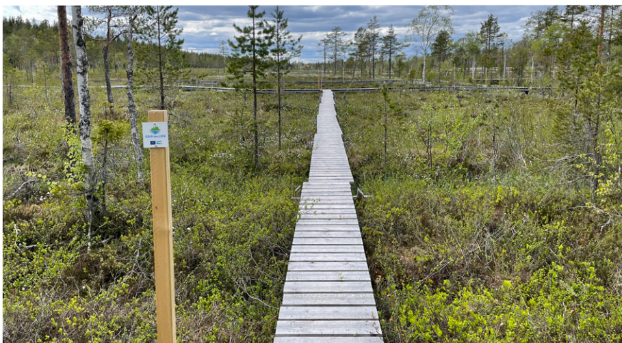
Spång som leder ut på Stormyran.

Vissa effekter såg ut att stabiliseras under tiden för studien medan andra förblev höga under hela mätperioden. För att fullt ut kunna förstå dikesåtgärdernas effekter på hydrologi och vattenkvalitet och utreda hur långvariga vissa av effekterna är behövs fortsatt långsiktig övervakning.