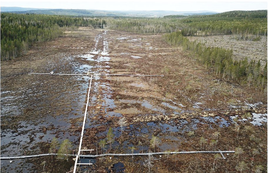
Översikt över Stormyran efter dikesigenläggningen.

Sammanfattningsvis har återvätningen haft en positiv påverkan på hydrologin genom att grundvattennivån höjts. Trots detta har Stormyran, som varit utdikad under ett sekel, ännu inte hunnit återfå sin naturliga funktion, vilket kan ta betydligt längre tid än tidsperioden för denna studie.