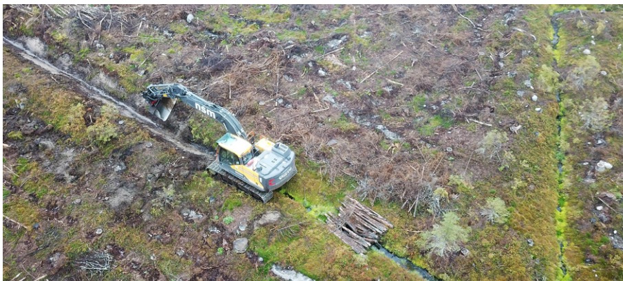
Dikesrensning efter avverkning.

Sammanfattningsvis dämpade dikesrensningen många av avverkningens negativa effekter på vattenkvaliteten. Trots detta kan avverkning i kombination med dikesrensning ändå sammantaget försämra vattenkvaliteten, särskilt genom ökad transport av partiklar.