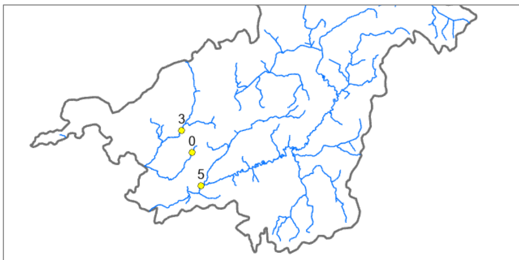
Figur 2 Illustration som beskriver hinders poängsättning i förhållande till mynning (se förklaring i texten ovan).

Hinders avstånd till mynningen har poängsatts genom att beräkna hindrets avstånd till mynningen i förhållande till hela vattendragets längd (upp- och nedströms). I exemplet i figur 2 ligger tre punkter (hinder) i tre olika vattendrag. Alla tre hindren ligger 2,5 km från mynningen. Det norra hindret har 5 km vattendrag uppströms, det vill säga totalt 7,5 km vattendraglängd. 2,5/7,5 = 33 \% , vilket skulle ge 3 poäng. Det mellersta hindret har 0,5 km vattendrag uppströms. 2,5/3 = 83\% vilket ger 0 poäng. Det södra hindret har en vattendragssträcka uppströms på 130 km. 2,5/132,5 = 2 \% vilket ger 5 poäng.