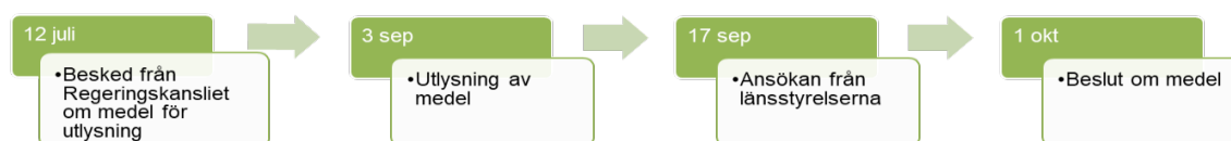
Figur 1: Process för utlysning av medel till regionala insatser 2018

Skogsstyrelsen har under 2018 fokuserat på utlysning och fördelning av medel. Det har bland annat inneburit att tolka och utforma villkor, kriterier och anvisningar samt att ta fram former för bedömning och beslut om utbetalning.